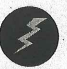
普通火災用 油火災用 電気火災用